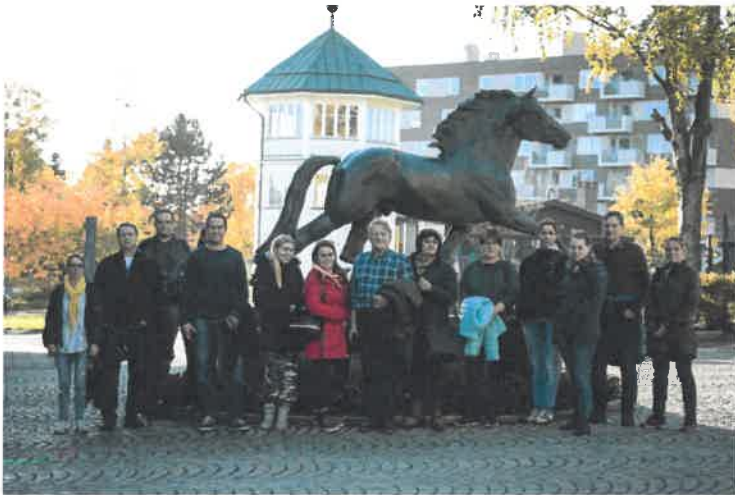
Opintomatkalaiset Bjerken ravikeskuksen edustalla