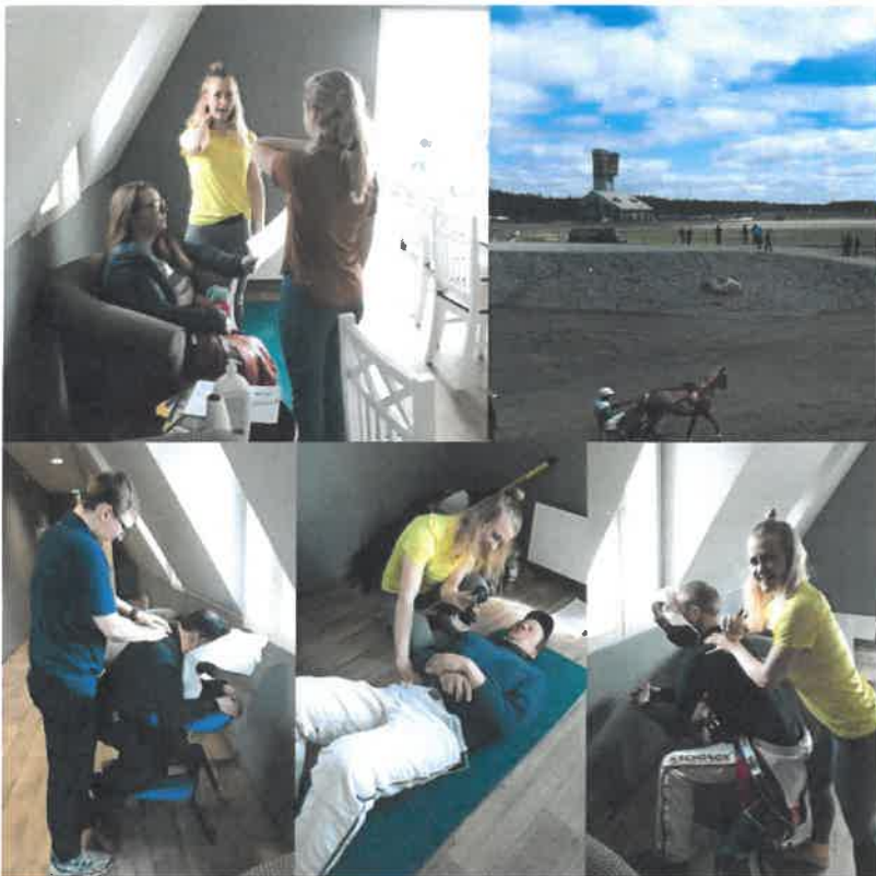
Raviohjastajat fysioterapia- ja osteopatiapalvelu Balanssin asiantuntijoiden käsittelyssä Alahärmässä 5.5.2018